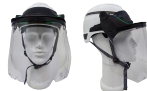
V-GARD sheet visor PC clear 10115837 avec casque with helmet V-GARD H1 et porte-écran and frame 10235987

Complément AET émis le 13/10/2023 (ref dossier AC23-08-0722) ajout de casque compatible V-GARD H1 et des portes écrans 10235987 et 10236392 Complement AET issued on 10/13/2023 (ref file AC23-08-0722): addition of compatible helmet V-GARD H1 and frames 10235987 and 10236392.