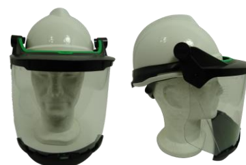
Ecran sur casque industrie V-GARD Face-shield on industrial helmet V-GARD

V-Gard sheet visor PC clear (2C-1,2 1B 3) 10115836 & 10115837 (avec mentonnière with chin guard ) 10115863 (écran plus long longer visor )