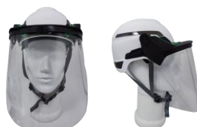
V-GARD sheet visor PC clear 10115863 avec casque with helmet V-GARD H1 et porte-écran and frame 10236392